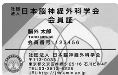
(1) 日本脳神経外科学会会員証（ICカード）

受付には（1）のみをご持参ください。（2）『日本脳神経外科学会会員カード（クレジットカード）』の持参は不要です。